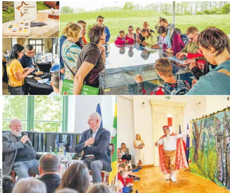
Spotkania, pikniki, koncerty... wydarzenia odbyły się w całym regionie.