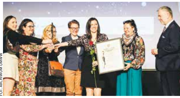
Przedstawiciele muzeum w Szreniawie odebrali Izabellę przyznawaną w kategorii „działalność wystawiennicza”.

Najwyższym wyróżnieniem w konkursie są Grand Prix. Te za 2025 rok w trzech z pięciu kategorii trafiły do instytucji podległych samorządowi województwa. Za „działalność wystawien-