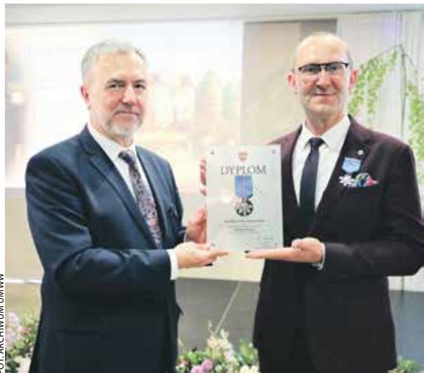
Jubileusz był okazją do wręczenia przez marszałka najwyższych regionalnych odznaczeń.

Samorząd województwa przekazał dofinansowanie dla zasłużonej kórnickiej instytucji oraz uhonorował związane z nią osoby.