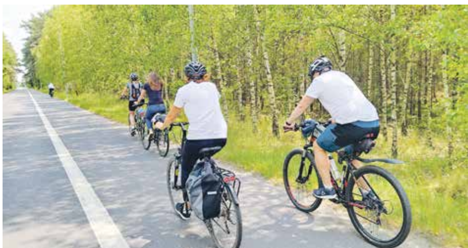
Nie zawsze potrzebne są osobne ścieżki rowerowe, czasami wystarczy wydzielony pas ruchu.

Jeżeli jednak szukać najdłuższej infrastruktury w granicach administracyjnych danej miejscowości, to oczywiście trzeba zerkać w kierunku największych miast regionu. W Poznaniu mamy aż 220 km tras rowerowych, w Pile – 72 km, w Kaliszu – 60 km. Natomiast jeśli chodzi o obszary wiejskie, to najdłuższa sieć takich dróg znajduje się w gminach wiejskich: Tarnowo Podgórne – 53 km, Kościan – 49 km oraz na obszarze wiejskim gminy miejsko-wiejskiej Oborniki – 42 km.