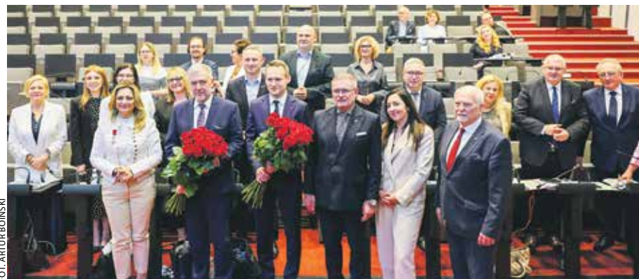
Po uzyskaniu przez zarząd absolutorium przedstawiciele sejmikowego prezydium wręczyli kwiaty marszałkowi i skarbnikowi województwa.

Mimo tych dobrych wieści głosowanie nad absolutorium poprzedziła wielo-