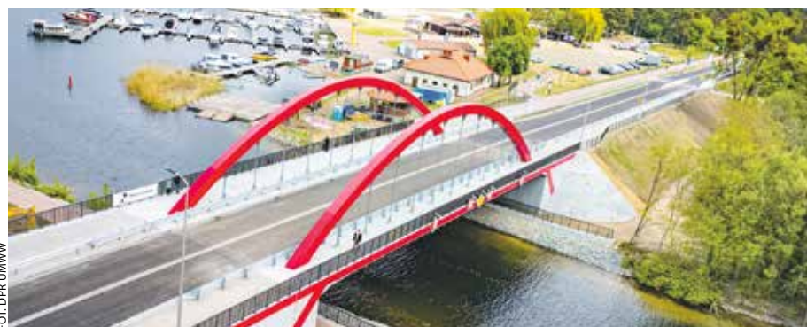
Most w Ślesinie jest położony w sąsiedztwie przystani wodnej.

To kompleksowe przedsięwzięcie. Pomyślano o wszystkich użytkownikach drogi – kierowcach, rowerzystach i pieszych. Długość przeprawy to 64 metry. Wybudowano na niej jezdnię o szerokości 7 metrów wraz z chodnikami po stronie południowej. Po stronie północnej powstała droga dla pieszych i rowerzystów. Konstrukcja stalowa