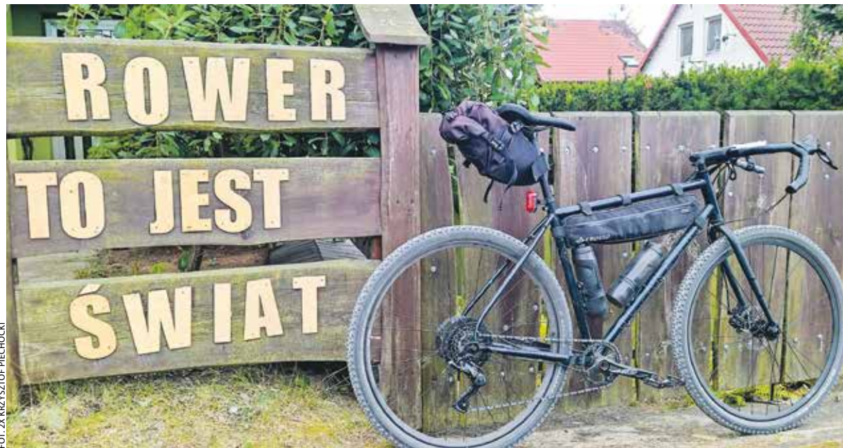
Zakochani w rowerowych podróżach Wielkopolanie z roku na rok mają do dyspozycji coraz lepszą infrastrukturę.

Tradycje budowy infrastruktury rowerowej w Poznaniu sięgają 1900 r. Wtedy powołano pierwsze stowarzyszenie cyklistów. Rowerzyści mieli w Poznaniu niełatwy żywot. „Odwieczny” konflikt w przestrzeni ulicznej pomiędzy cyklistami a automobilistami trwa już od I wojny światowej. Ale najwcześniejsze powody budowy infrastruktury rowerowej były inne. Rower wymagał gładkiej, a przez to wygodniejszej i bezpieczniejszej nawierzchni niż powszechne wówczas „kocie łby”. Dlatego początkowo zaczęto wytyczać trasy dla rowerzystów wyłożone specjalnymi płaskimi kamieniami, aby odseparować ich od powozów konnych. W latach 30. w Poznaniu rowerzyści stanowili już połowę uczestników ru-