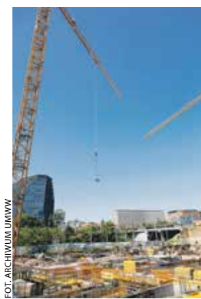
Teatr powstaje tuż obok Akademii Muzycznej i Ronda Kaponiera.

– Projekt, mam nadzieję, zostanie wpisany na listę tzw. projektów niekonkurencyjnych, które nie podlegają już procedurze konkursu, tylko wchodzą do realizacji – tłumaczył marszałek. – W ramach tego wyposażenia pojawi się cała część sceniczna, czyli oświetlenie, nagłośnienie i multimedia. Zainstalowane będą też siedziska, zarówno w sali głównej na 1200 osób, jak i w sali kameralnej na 300 osób, z zapewnieniem odpowiedniej przestrzeni dla osób z niepełnosprawnościami.