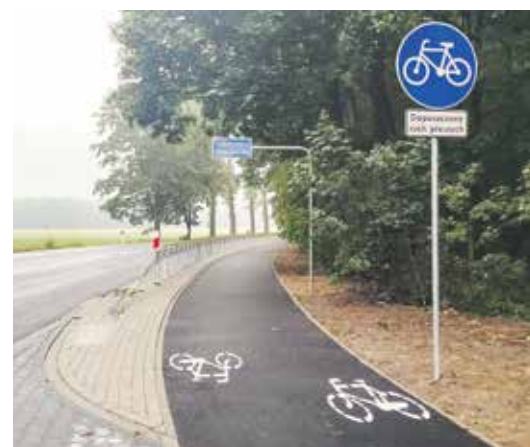
Jedna ze ścieżek wybudowanych przez WZDW – przy odcinku DW 308 w powiecie grodziskim.