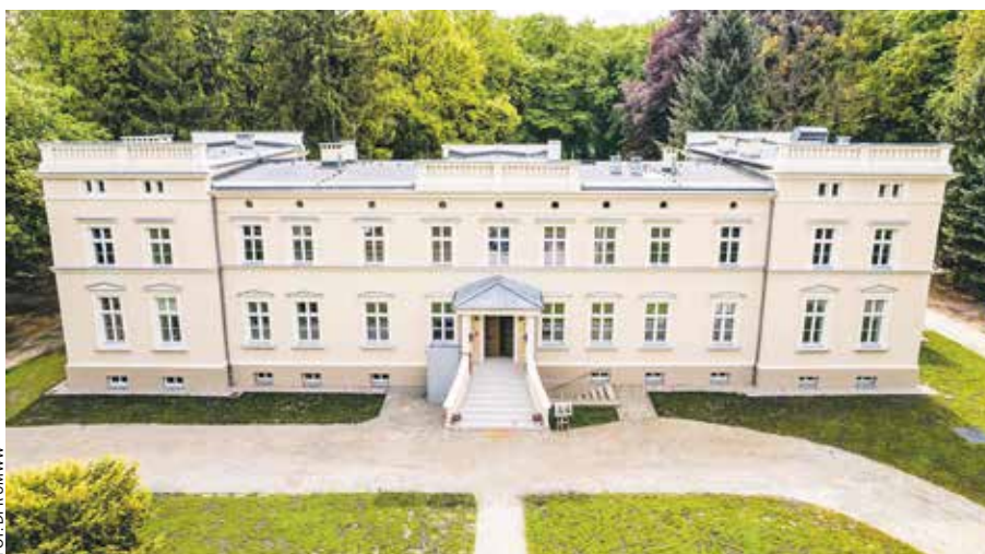
To jedna z pierwszych inwestycji kulturalnych ukończona z puli FEW.

Prace remontowo-budowlane zakończyły się także w XIX-wiecznym pałacu w Rościnnie (gmina Skoki). To inwestycja szczególna, bo dotyczy miejsca o dużym znaczeniu historycznym, społecznym i duchowym. Od teraz pałac będzie pełnił funkcję nie tylko domu rekolekcyjnego, ale również centrum kulturalno-edukacyjnego, otwartego na organizację warsztatów, spotkań, wydarzeń artystycznych, edukacyjnych i prospołecznych.