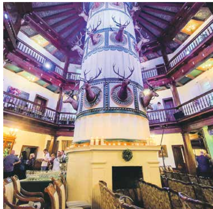
Pałac w Antoninie zaskakuje oryginalnymi kształtami, a przede wszystkim niepowtarzalną atmosferą.