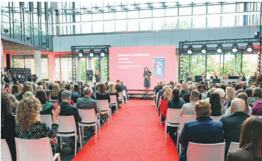
Tym razem za scenografię dla wydarzenia posłużyło patio w Urzędzie Marszałkowskim Województwa Wielkopolskiego.

– Trudno sobie wyobrazić kulturę w samorządzie lokalnym bez bibliotek, bo to dla niej fundament. Godne odnotowania jest to, jak wielki dokonał się postęp, jak bardzo nowoczesnymi placówkami kultury stały się biblioteki – mówił podczas wyda-