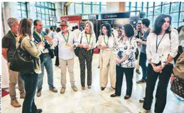
Podczas wizyty w Andaluzji wielkopolscy przedsiębiorcy odwiedzili m.in. międzynarodowe targi pracy w Grenadzie.

Jak się okazuje, przedsiębiorcy z naszego regionu są zainteresowani poszukiwaniem osób do pracy także w krajach zachodnioeuropejskich.