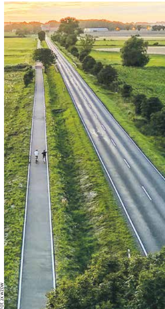
Efektowne ujęcie drogi rowerowej przy DW 312 na odcinku Wielichowo – Ziemin.