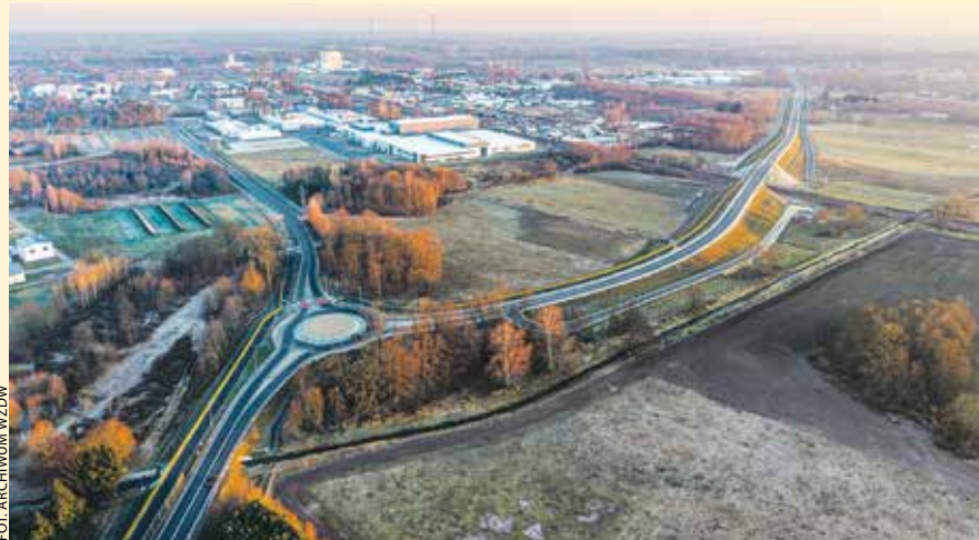
Widok nowego przebiegu drogi w Nowym Tomyślu. Ta inwestycja pozwoliła uwolnić kierowców od długiego oczekiwania na przejeździe kolejowym w tym mieście.

DW 305 nie jest może najdłuższą z dróg wojewódzkich w Wielkopolsce, a jednak to jedna z najważniejszych tras będących w gestii regionalnego samorządu. Stąd wiele nakładów inwestycyjnych poniesionych na rozwój tej arterii.