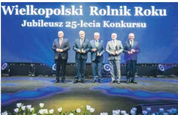
Tym razem statuetki „Siewcy” trafiły do rąk samorządowców i naukowców.

Wręczono także pamiątkowe medale z okazji ćwierćwiecza konkursu, specjalnie przygotowane na tę okazję. Otrzymały je osoby i instytucje zaangażowane w realizację konkursu, prace przy jego przygotowaniach oraz wspieranie wielkopolskich rolników. Uhonorowano także laureatów wszystkich 25 edycji przedsięwzięcia. ABO