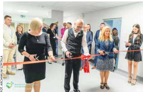
Uroczystość otwarcia zmodernizowanego oddziału odbyła się w Lesznie 26 maja.

W ramach modernizacji wymieniono wykładziny podłogowe wraz z naprawą podłoża, okładziny ścienne oraz stolarkę drzwiową. Na