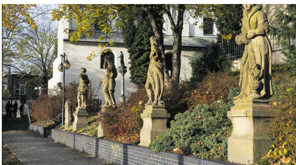
Cztery Pory Roku