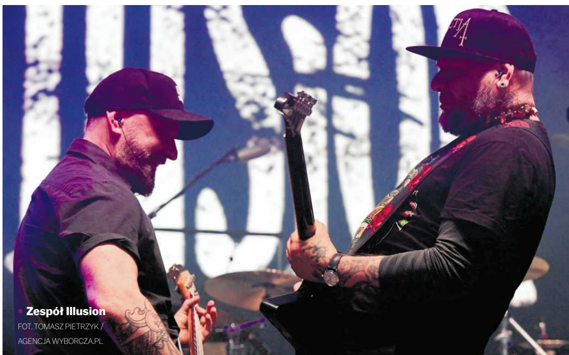
• Zespół Illusion