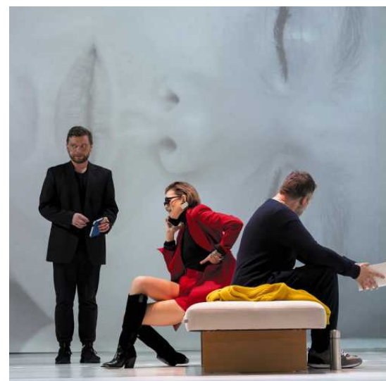
Cztery dobre powody by rzucić wszystko w cholerę, reż. Norbert Rakowski, fot. Edgar de Poray