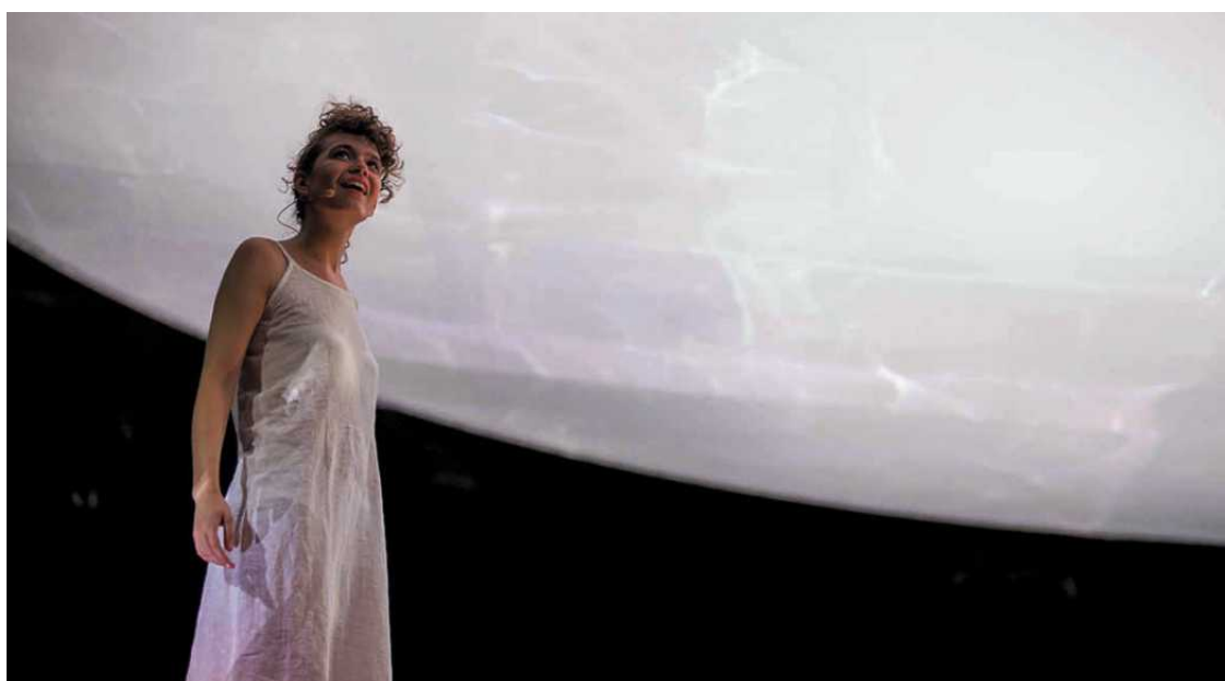
Romeo i Julia, reż. A. Keresztes

W nowym sezonie przygotowaliśmy bogatą ofertę i atrakcyjne promocje, w tym dla studentów i seniorów.