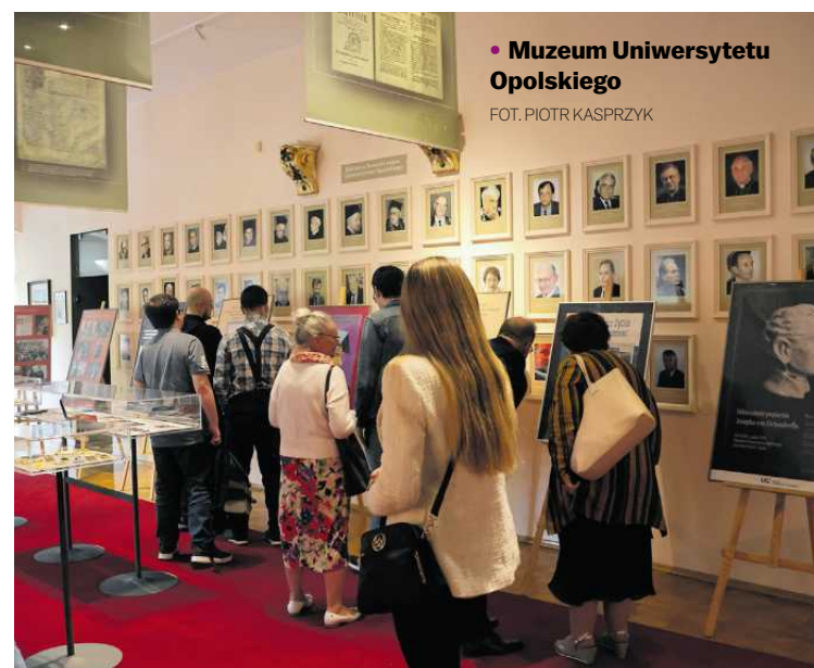
• Muzeum Uniwersytetu Opolskiego