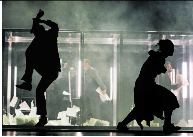
• Spektakl „Burza”