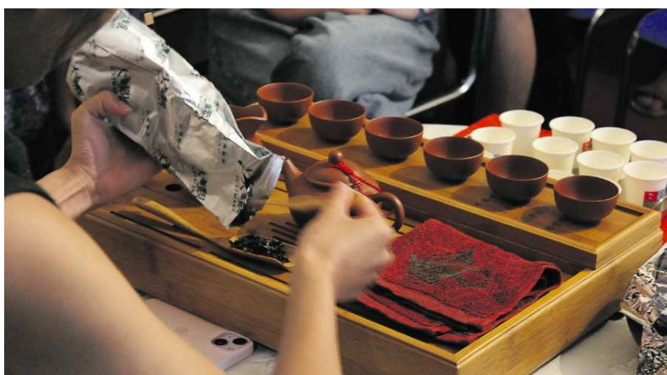
Noc Kultury