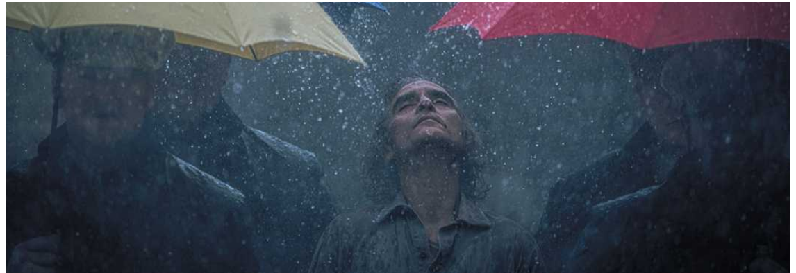
Kadr z filmu „Joker: Folie a Deux”