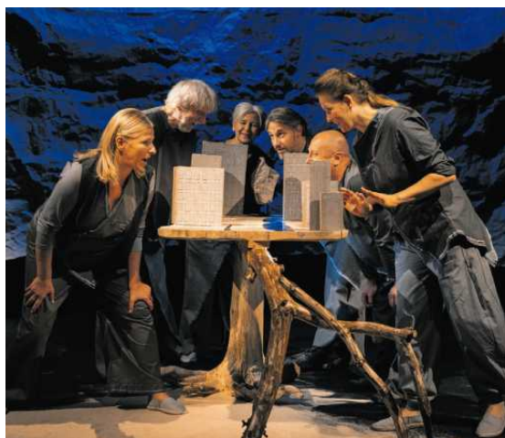
Opowieści piaskiem pisane