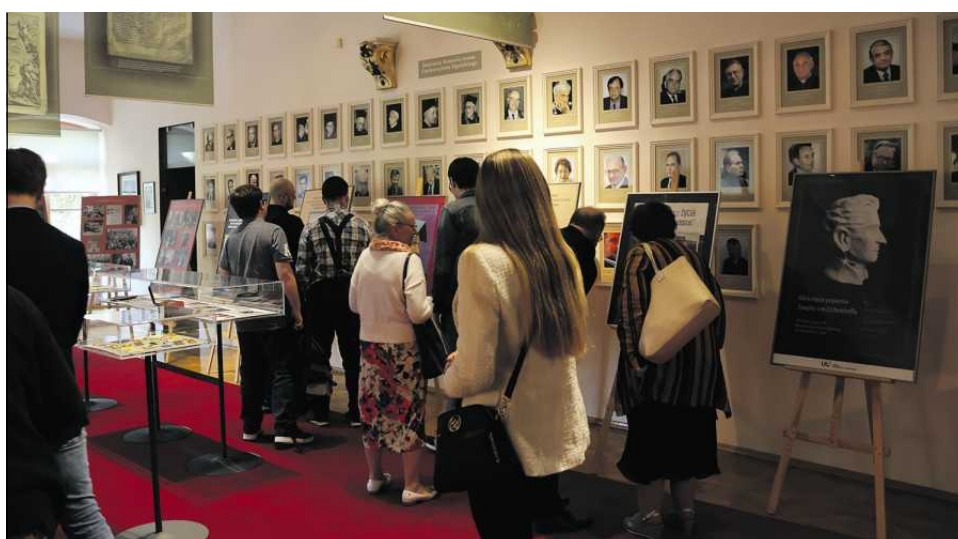
Wystawa z okazji 10-lecia Muzeum UO