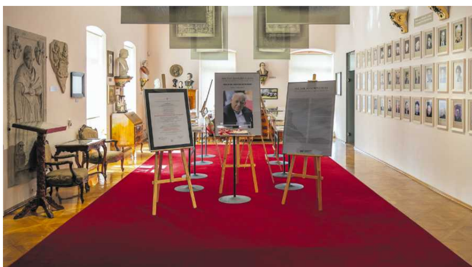
Wystawa poświęcona prof. F. Markowi

Muzeum Uniwersytetu Opolskiego (budynek Collegium Maius) pl. Kopernika 11, 45-040 Opole Godziny otwarcia Poniedziałek–piątek 10.00–16.00 tel. +48 77 541 59 50, e-mail: muzeumuo@uni.opole.pl www.facebook.com/muzeum.uni.opole/