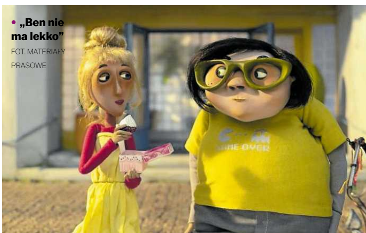
• „Ben nie ma lekko”