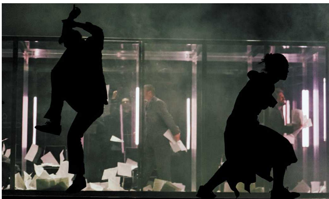
Burza. Regulamin wyspy, reż. K. Minkowska, fot. Edgar de Poray

Od stycznia zapraszamy na wydarzenia związane z jubileuszem 50-lecia Teatru im. Jana Kochanowskiego. Szczegóły ogłosimy już wkrótce.