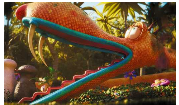
Kadr z filmu „Smok Diplodok”