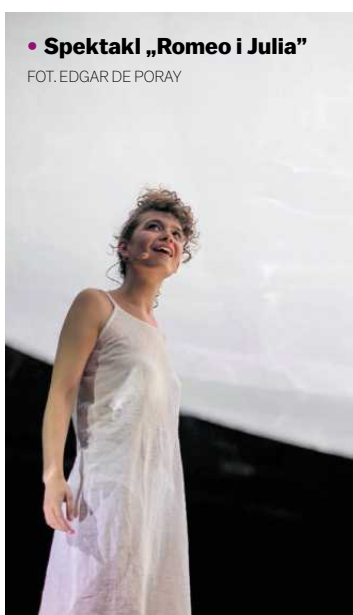
• Spektakl „Romeo i Julia”