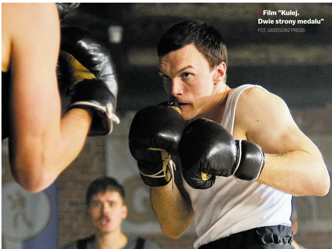
• Film "Kulej. Dwie strony medalu"