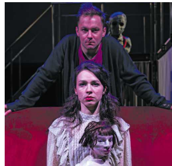
Ja, Hamlet