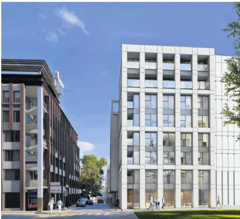
• Piekary 18

Odnotowano jeszcze jedno ciekawe zjawisko na poznańskim rynku nieruchomości. Okazuje się, że w Poznaniu króluje kapitał własny, a przynajmniej do pewnego pułapu cenowego. W liczbach wygląda to tak (według danych Otodom Analytics): 54 proc. wszystkich transakcji realizowanych jest w większości za gotówkę, a 32 proc. opiera się w większości na kredycie.