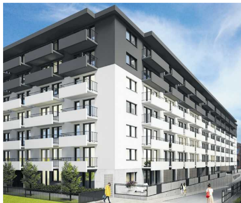
• Tarasy Wilczak

Są tu 182 mieszkania o powierzchniach od 40 do 106 mkw. z balkonami lub tarasami w standardzie deweloperskim. Cena mieszkania od 11 500 zł/mkw. Wybrane mieszkania można kupić z rabatem 35 000 zł na 35 lat Ataner. Cena miejsca postojowego w hali 3500 zł/mkw + VAT. Niektóre z mieszkań są wykończone pod klucz.