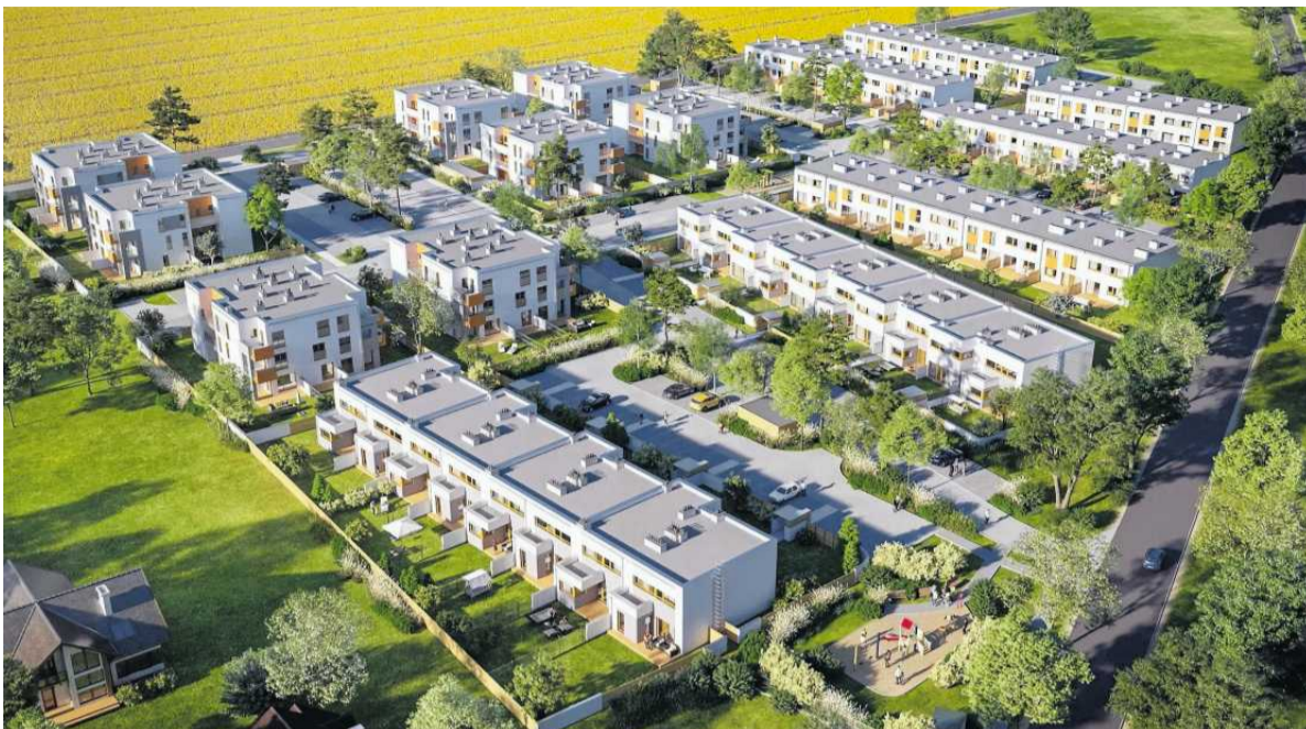
• Osiedle Stolarska

Budynek wielorodzinny deweloperski dodatkowo z opcją pod klucz. W ramach inwestycji powstał jeden, elegancki budynek mieszkalny o trzech kondygnacjach – wysoki standard – elektryczne rolety, trawa z rolki, wyszpaczkowane i pomalowane ścia-