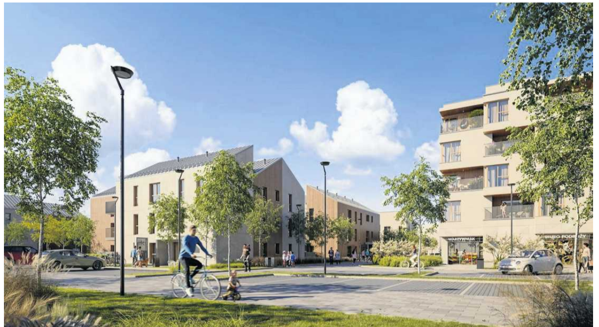
• Osiedle Naturama