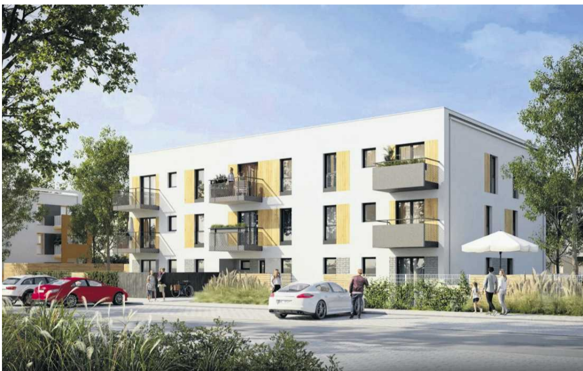
• Osiedle Nad Strumykiem

Aktualnie ceny nowych mieszkań w Poznaniu pozostają stabilne,