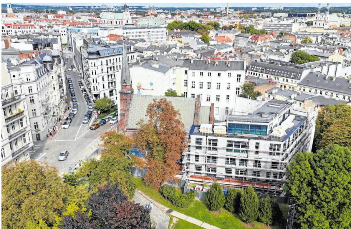
• W sierpniu 2025 padł rekord podaży na poznańskim rynku deweloperskim – w ofercie było w sumie ponad 8,6 tys. lokali

Ale skąd właściwie bierze się ta różnica i jakie ma znaczenie w praktyce?