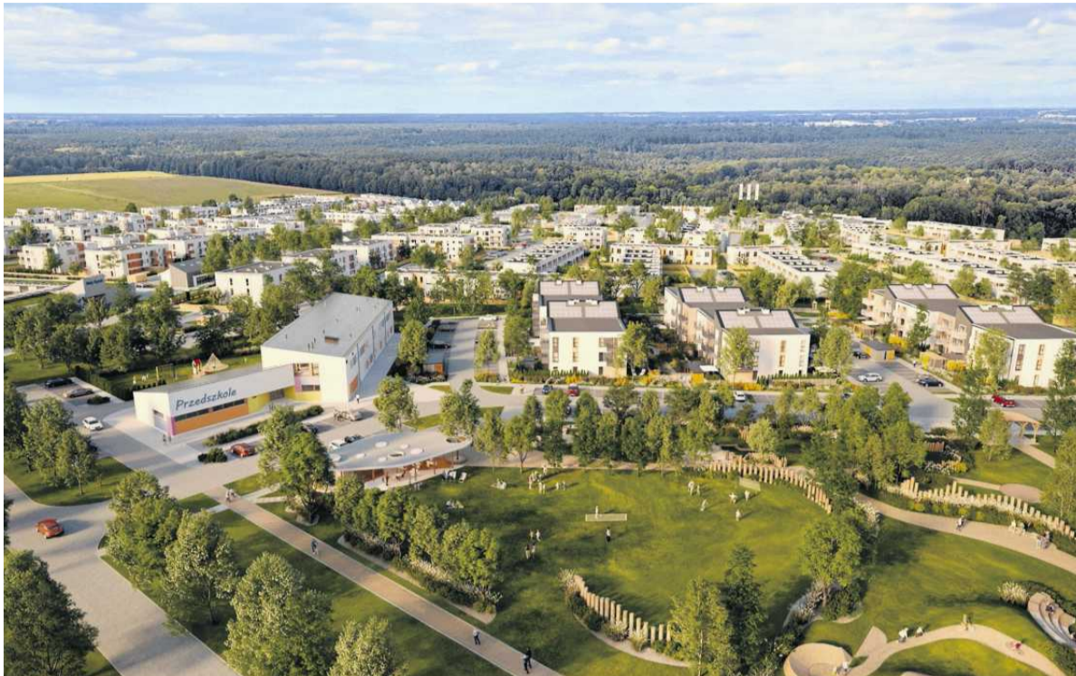
• Osiedle Dąbrówka