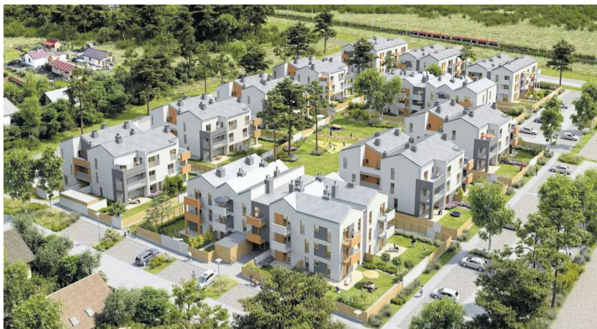
• Osiedle Pogodna

ku. Szybki dojazd do Poznania. Funkcjonalne układy mieszkań. Ekologiczne rozwiązania technologiczne. Mieszkania są gotowe.