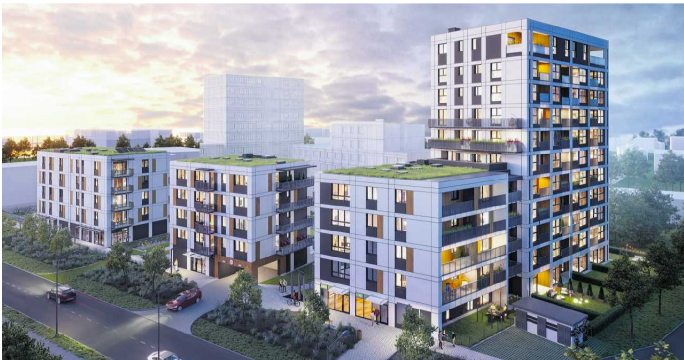
• Świętego Michała etap II

Z danych portalu RynekPierwotny.pl wynika, że w maju tego roku średnia (ofertowa) cena metra kwadratowego w Poznaniu wynosiła tu 14 248 zł. To daje piąte miejsce w zestawieniu siedmiu największych i równocześnie najdroższych polskich aglomeracji