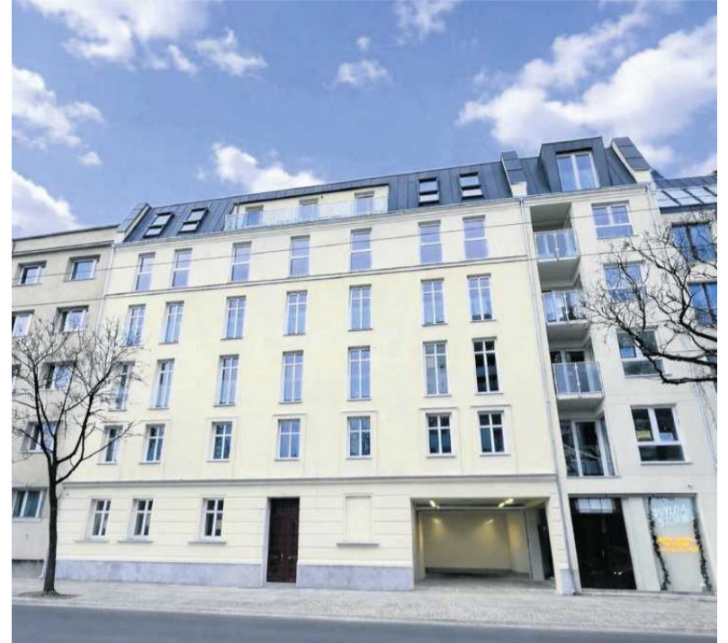
• Wilda Story FOT. MATERIAŁY PRASOWE