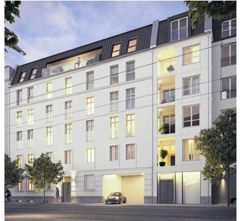
• Wilda Story

W kameralnym, dwukondygnacyjnym budynku znajdzie się zaledwie II mieszkań.