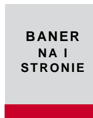
205 x 35 mm + spad