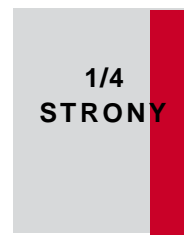
43 x 270,7 mm (w ramce) 54 x 295 mm + spad (pełny)