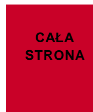
184 x 270,7 mm (w ramce) 205 x 295 mm + spad (pełny)