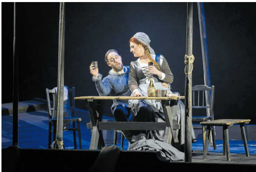
• Rigoletto w reżyserii Marcina Bortkiewicza zostanie wystawione 8, 9, 10, 11 i 13 maja

Nietypowe – przynajmniej jak na teatr operowy – będą dwa koncerty, które zabrzmiały w przededniu święta zmartwychwstania. Stabat Mater Pergolesiego i Requiem Faurégo to utwory wykonywane raczej w salach filharmonii czy w przestrzeniach sakralnych. 17 kwietnia w Teatrze Wielkim wystąpią gwiazdy poznańskiej sceny oraz chór i orkiestra pod batutą maestro Jacka Kaspszyka. Będzie można ich posłuchać tylko tego jednego dnia. Szykuje się więc wydarzenie pod każdym względem unikatowe. ●